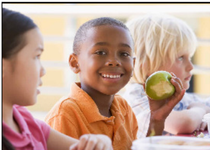
Au cours de la préparation des boîtes à lunch de vos enfants, il est important de respecter les règles en matière de salubrité alimentaire et de saine manipulation des aliments.

Pour obtenir de plus amples renseignements sur la salubrité des aliments, consultez le bulletin La salubrité au dîner ou la page School Nutrition d'Alberta Health Services à l'adresse www.albertahealthservices.ca (en anglais seulement).